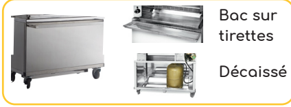
Soubassement inox à roulettes Décaissé