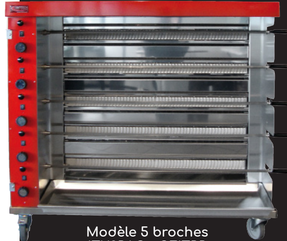
Modèle 5 broches ITX3RAG + SEITRR