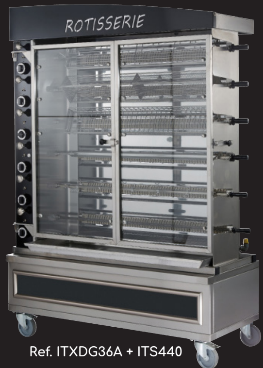
Ref. ITXDG36A + ITS440