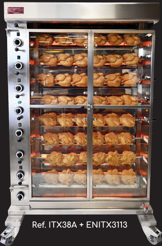
Ref. ITX38A + ENITX3113

* Profondeur 775 mm uniquement sur roulettes car déport