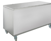
Soubassement inox à roulettes