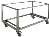
Socle inox à roulettes