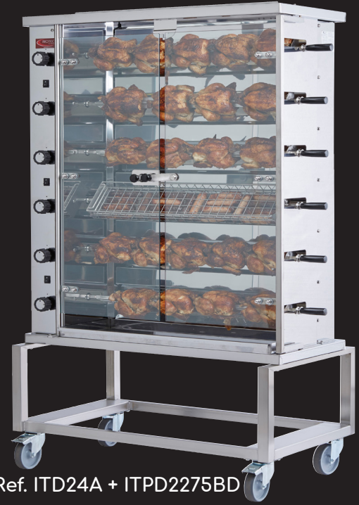
Ref. ITD24A + ITPD2275BD